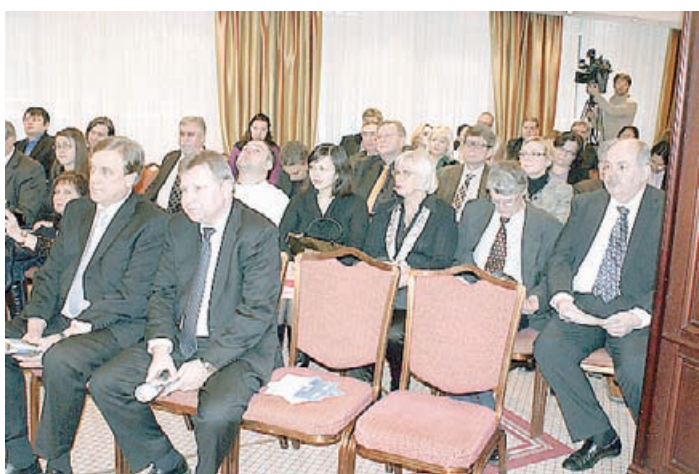
У финских журналистов особенно много было вопросов по поводу «ваучеров», заменяющих визы. Многие так и не поняли: а для чего они, вообще, нужны?

сажиров в Дании. Судно четырехжды перестраивалось и ремонтировалось, сейчас зафрахтовано новой судходной компанией "St. Peter Line". Корабль будет курсировать между двумя столицами под флагом Мальты. Планируется, что за год паром "St. Peter Line" сможет перевезти до полумиллиона пассажиров, из которых